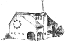
Christ König Holzlar

Pfarnachrichten vom 29.02. bis 15.03.2020