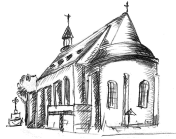
St. Adelheid Pützchen