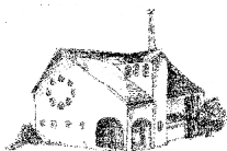
Christ König Holzlar

Pfarnachrichten vom 23.05. bis 31.05.2020