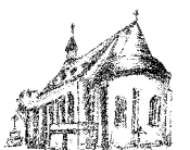
St. Adelheid Pützchen