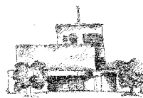
St. Antonius Holtorf