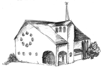
Christ König Holzlar

Pfarnachrichten vom 22.08. bis 30.08.2020