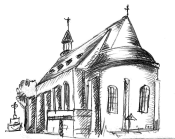
St. Adelheid Pützchen