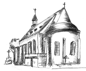
St. Adelheid Pützchen