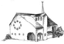
Christ König Holzlar

Pfarnachrichten vom 27.02. bis 07.03.2021