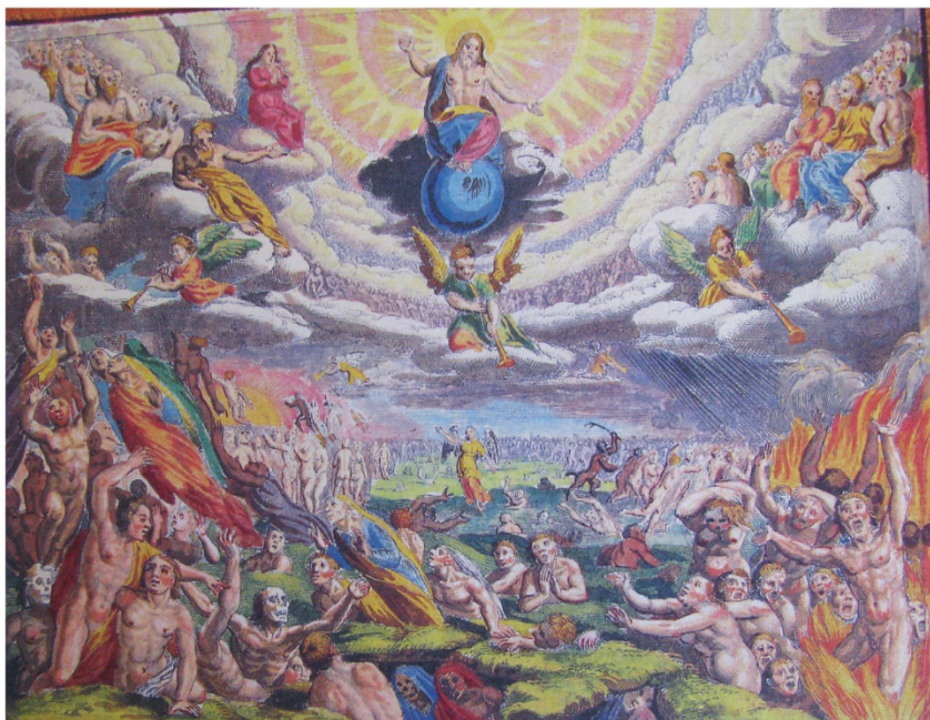
Matthäus Merian der Ältere

Der Glaube an die Wiederkunft Christi ist so zunächst die Absage an die innergeschichtliche Vollendbarkeit der Welt und gerade mit diesem negativen Gehalt der Schutz des Menschen vor der Entmenschlichung durch sich selbst.